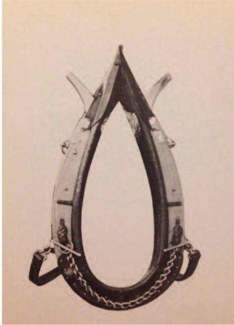
SOPHIE NYS NOT A SHOE.

Linke Wienzeile 36 / 1C, 1060 Wien www.ermes-ermes.com / www.guimaraes.info