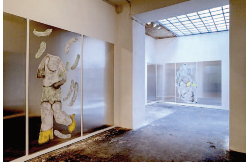
SASKIA TE NICKLIN Ham-Fisted Garden Party

Brucknerstrasse 6, 1040 Wien www.lisaruyter.com